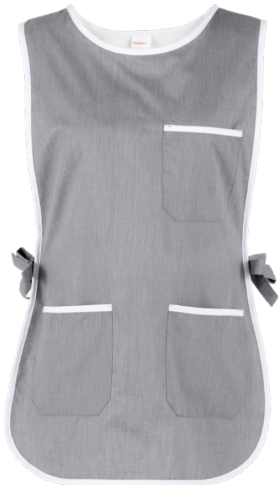
C02 Grigio chiaro